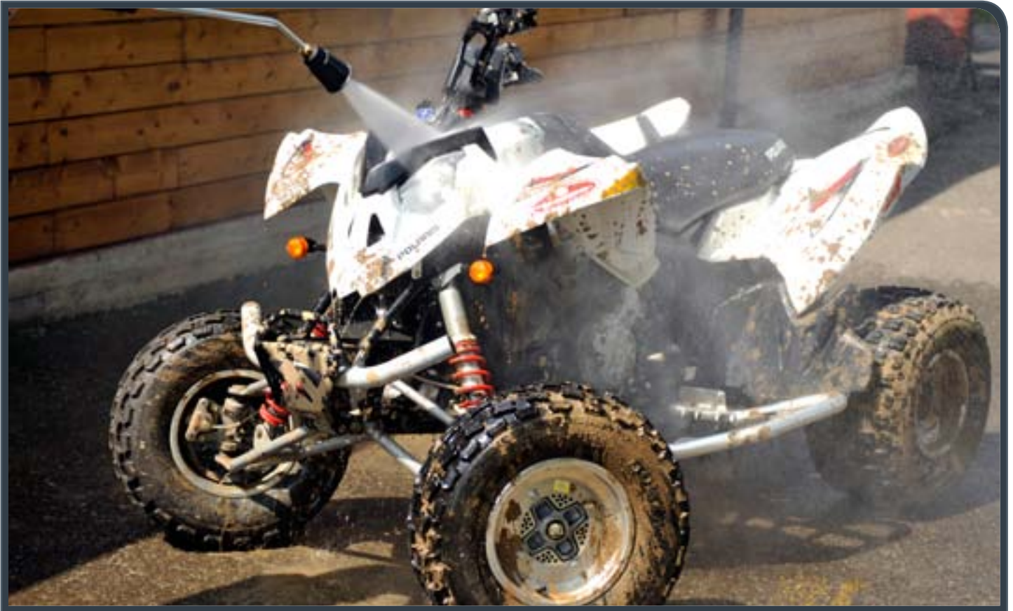
Applicazione • Use