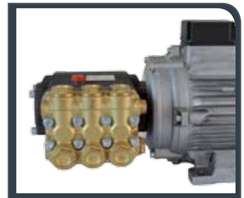
Dettaglio pompa - Pump detail