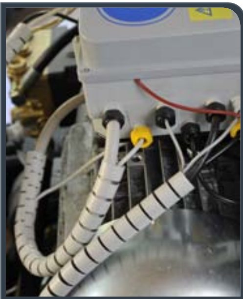
Interno • Inside